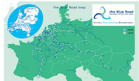
Blue roadmap, bron: www.bureauvoorlichtingbinnenvaart.nl