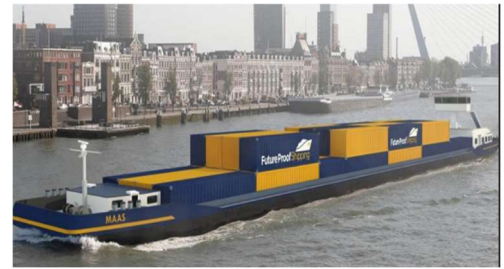
De Maas met Retrofit op Waterstof (Fuel-Cell) van Future Proof Shipping

En daarmee hebben we een mooie uitdaging te pakken. Om de binnenvaartvloot te verduurzamen zijn veranderingen nodig in de hele keten: van verlader, schipper, eigenaar tot werf, toeleverancier en bunkerpunt. Dit betreft dan niet alleen de Nederlandse binnenvaart, maar ook de binnenvaart en infrastructuur binnen de Europese Unie. Een schip dat uit Rotterdam vertrekt zal immers onderweg een bunkerpunt (ofwel “tankstation”) nodig hebben om tijdig energie te bunkeren. Veranderen kost veel geld en tijd en het is lastig om in te schatten of investeringen die je nu doet op den duur voldoende rendement gaan opleveren.